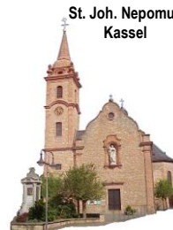
St. Joh. Nepomuk Kassel

12. und 13. Sonntag im Jahreskreis 24.06. - 09.07. 2017