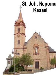
St. Joh. Nepomuk Kassel

19. Sonntag im Jahreskreis 13.08. - 20.08. 2017