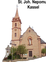
St. Joh. Nepomuk Kassel

07. Jahreskreiswoche 22.02. bis 01.03.2020